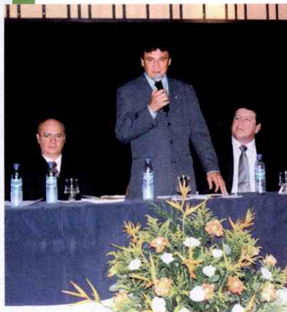
Governador Wellington Dias declara posse da nova diretoria