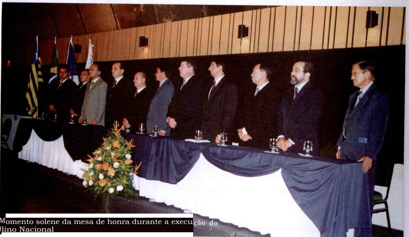
Momento solene da mesa de honra durante a execução do Hino Nacional